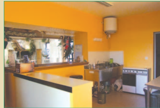
Cuisine équipée et coin repas.